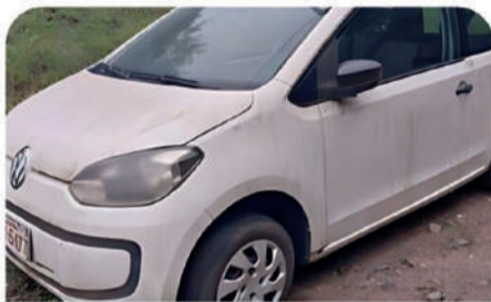
Veículo VW/UP TAKE MA Ano/modelo: 2014/2015