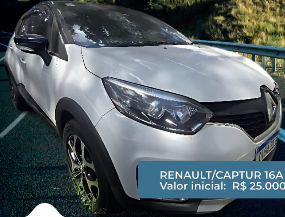
RENAULT/CAPTUR 16A 2018 Valor inicial: R$ 25.000,00