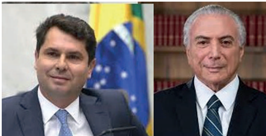
ALEXANDRE CURI E MICHEL TEMER

A Assembleia Legislativa do Paraná promove, no próximo dia 23 de abril, o lançamento oficial da Rede Estadual de Educação Legislativa, uma iniciativa estratégica voltada ao fortalecimento do Poder Legislativo por meio da capacitação, integração e troca de conhecimentos entre instituições públicas. O evento será realizado às 18h, no Plenário da Assembleia, em Curitiba, reunindo