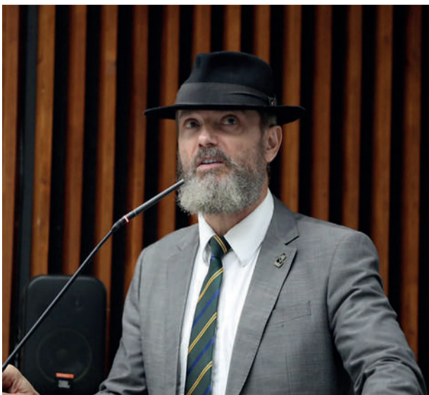
Delegado Tito Barichello

O avanço de propostas voltadas à segurança privada tem ampliado o debate entre proteção profissional e legislação no país. Nesse cenário, o deputado estadual Delegado Tito Barichello (União), líder do Bloco Parlamentar de Segurança Pública da Assembleia Legislativa do Paraná, tem defendido mudanças que reforçam a segurança de vigilantes, enquanto acompanha a tramitação de projetos em nível federal.