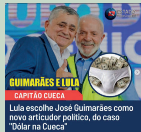
GUIMARÃES E LULA