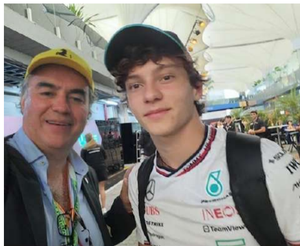
DANIEL E ANTONELLI. Surge um novo fenômeno na F1, Kimi aos 19 anos batendo recordes. Nesse final de semana foi o primeiro piloto nos 76 anos da F1 a ganhar 4 corridas seguidas após obter sua primeira vitória.

Encerrada a quinta etapa da F1 com a corrida do Canadá nesse final de semana em Montreal, o que notamos foi o domínio total, mais uma vez, da equipe Mercedes que sobrou em relação as demais. Começou