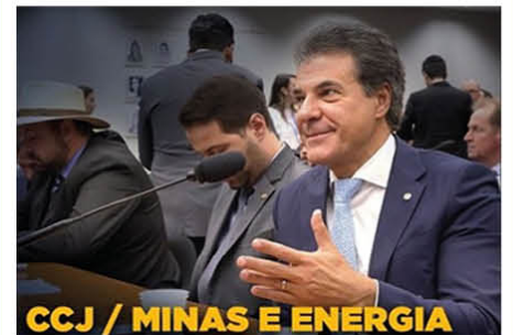
CCJ / MINAS E ENERGIA

O ex-governador e deputado federal Beto Richa (PSDB-PR) irá atuar na CCJ, que decide a viabilidade jurídica e a constitucionalidade das medidas do governo e também na Comissão de Minas e Energia, que é ligada ao reforço de fontes de energia limpa e renovável do país.