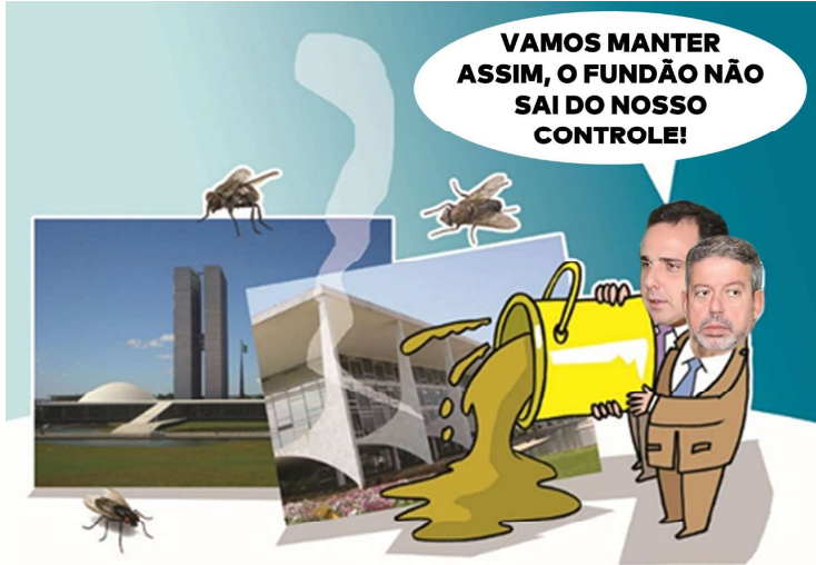
Arthur Lira (PP) e Rodrigo Pacheco (PSD)

Já pode se dizer que o tema das eleições do ano que vem vai ser o "VALE A PENA VER DE NOVO" , isto em função de que apesar da aprovação do projeto de mini-reforma eleitoral aprovado pela Câmara dos Deputados, as novas regras que foram anunciadas não terão efeito para as eleições de outubro de 2024 onde serão eleitos os novos prefeitos e vereadores.